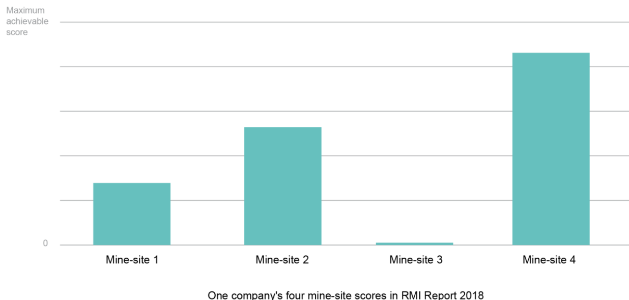
Figure 3 RMI Report 2018 results: Good practice ESG disclosure at one mine site, related to lender requirements, is not applied consistently across a company's assets

Demikian pula halnya investor seperti IFC yang telah menetapkan bahwa pengungkapan kontrak merupakan komitmen wajib bagi semua proyek tambang yang mereka dani, meskipun repositori kontrak online mereka 8 masih belum lengkap sepenuhnya – dan sepertinya hal ini tidak berpengaruh pada pendekatan perusahaan dalam melakukan transparansi kontrak untuk aset-aset lain perusahaan pada tersebut.